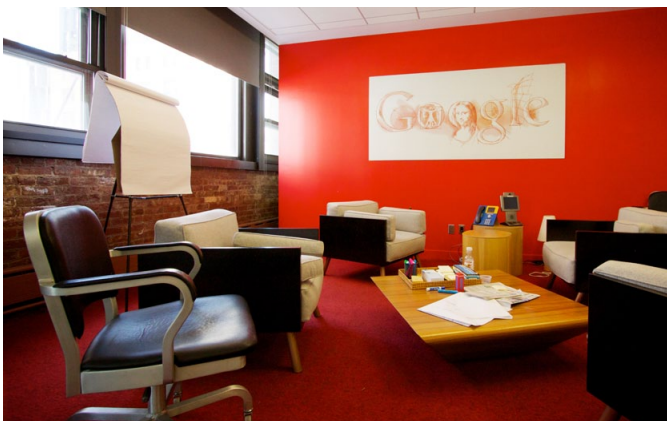
Sala de reuniones de Google.

Está demostrado que crear ambientes que permitan “desconectar” al trabajador dentro del propio centro, establecer programas de formación disruptiva y alentar los intereses personales de éstos es una forma de promover su creatividad en el trabajo y, por tanto, su productividad e implicación en el mismo. Con esta actividad pretendemos provocar ese espíritu de curiosidad, autocrítica y superación creativa a vuestro centro de estudios.